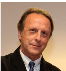
Francesc Jordana i Riba

Com no podia ser d'altra forma, hem d'encapçalar aquest número de la nostra revista electrònica parlant dels 50 anys de l'Escola .