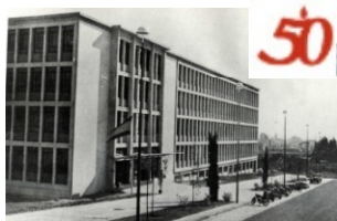
Escuela Técnica de Aparejadores 1961