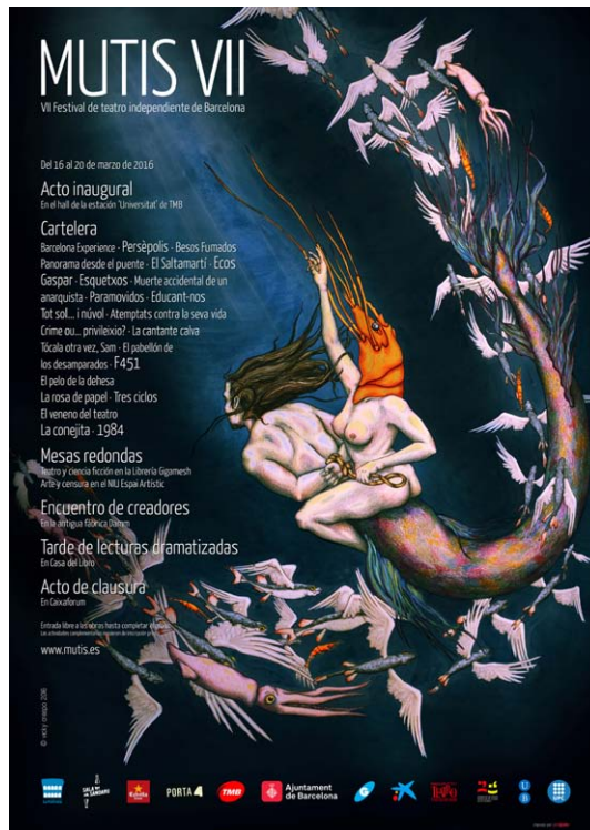
Disseny de samarretes i cartells de Victoria Crespo