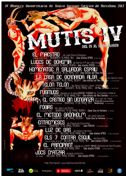
Imatge del cartell promocional de la IV edició. Disseny de Victoria Crespo

Potenciar les sinergies entre grups i agents culturals de la ciutat, fomentar l'associacionisme i augmentar el número de col·lectius implicats amb noves sensibilitats respecte edicions anteriors. Es tracta d'aportar tècnica i coneixements per mitjà de espais de convivència, tallers i dinàmiques amb els grups forans assistents, amb una forta implicació en les vetlles teatrals, on és més fàcil que els grups es sedueixin amb propostes de petit format molt variades.