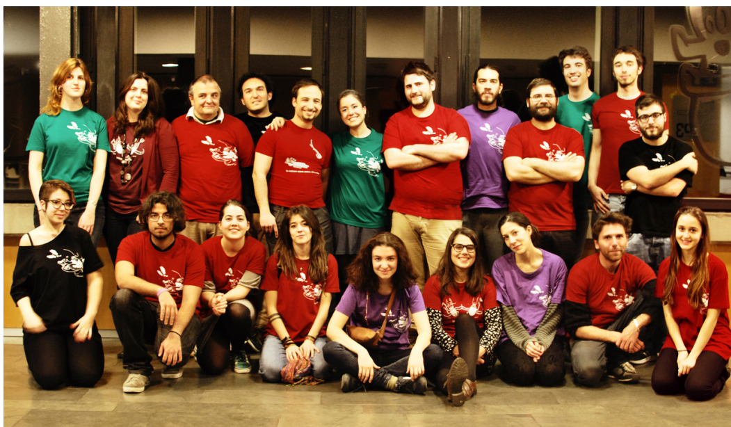
Reunió de voluntaris els dies previs al VII Festival MUTIS

Federació de Grups Amateurs de Teatre de Catalunya, Federació Espanyola de Teatre Universitari, Aula de Poesia de Barcelona, Fundació TMB, Fundació "La Caixa", Fundació Estrella DAMM, Associació La Escuelita, La Jarra Azul, Colectivo Suelto, Malaestirpe Teatro, Caín Teatro, Mutis por el foro, Mamadou Teatro, Lobishomes, Barracón Teatro, Col·lectiu Tarony-ia, Viridiana Teatro, Velum Teatro, Ateneu Adrianenc, Aula de teatre de Lleida, Aula de teatre de Barcelona, Aula de teatre de València, Aula de teatre de la UIC, Aula de teatro de Ourense, Sombrero 3, TECU Teatro, La Meridiana, Grup de Joves del Palau Alós, La Sacristia Teatre, AulaScenica, Adagio Teatre, Trastelón Teatro, Pinchacarneiro, Teatro da Falúa i Mequetrefes.