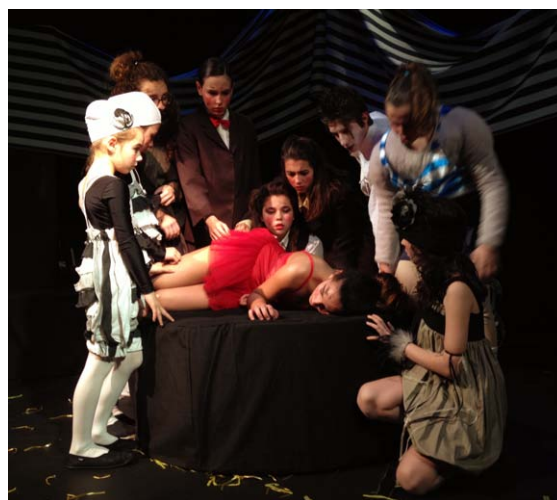
Teatre amb un grup de entre 8 i 13 anys al VI MUTIS