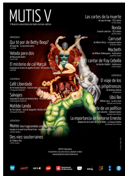
Imatge del cartell promocional de la VII edició. Disseny de Victoria Crespo

Des de l'any 2010, de la mà d'Alberto Rizzo, el festival s'ha anat consolidant com a festival de referència a nivell nacional: s'ha passat de les 7 obres presentades a la primera edició a les més de 25 de l'edició d'enguany.